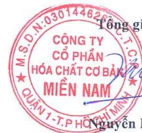
Nguyễn Hữu Thọ