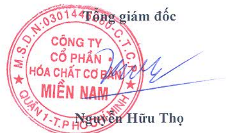
Nguyễn Hữu Thọ